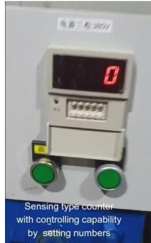
Sensing type counter with controlling capability by setting numbers

للإنتاج الأوتوماتيكي بالأرقام التحكم عداد